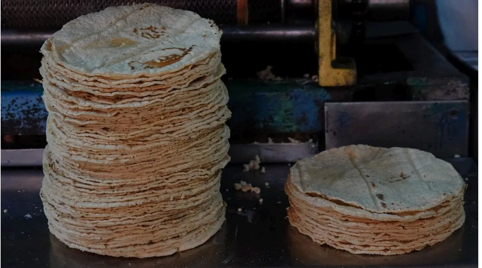
Ahora se podrán realizar recargas de saldo para el celular y pagar servicios como el recibo telefónico o de luz en la tortillería de la esquina

Ahora se podrán realizar recargas de saldo para el celular y pagar servicios como el recibo telefónico o de luz en la tortillería de la esquina.